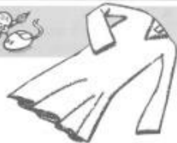
a yellow polka-dot nightdress