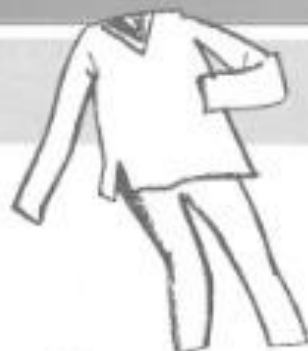
blue striped pyjamas