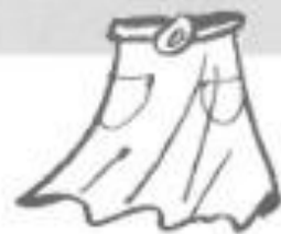
a green spotted skirt